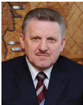
Вячеслав Шпорт Губернатор Хабаровского края

Несмотря на суровые природно-климатические условия и транспортную удаленность от регионов, производящих зерновые, население региона обеспечено сельскохозяйственной продукцией собственного производства: