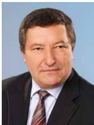
Олег Бетин Глава администрации Тамбовской области

Агропромышленный комплекс — один из ключевых секторов экономики области, здесь производится 20% валового регионального продукта. Развитие АПК является приоритетом в развитии региона.