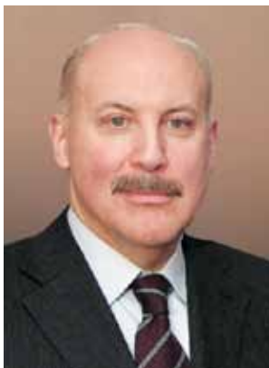
Дмитрий Мезенцев Губернатор — Председатель Правительства Иркутской области

Агропромышленный комплекс Приангарья является социально ориентированной отраслью экономики области, которая позволяет интегрировать межотраслевые экономические процессы, эффективно решать вопросы