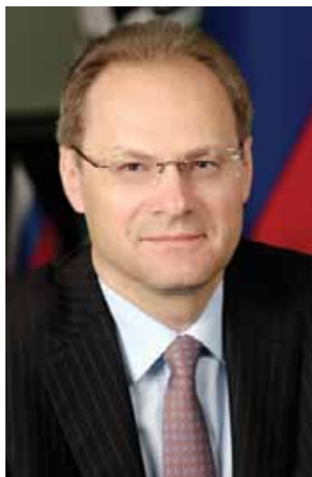
Василий Юрченко Губернатор Новосибирской области

Сельское хозяйство Новосибирской области является одним из ведущих в России. По объемам производства сельскохозяйственной продукции регион входит в первую десятку субъектов Российской Федерации, находясь в числе лидеров в Сибирском федеральном округе.