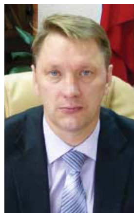
Николай Мизинин Министр сельского хозяйства, пищевой и перерабатывающей промышленности Камчатского края

В последние годы сельское хозяйство региона получило новый импульс к росту. Сегодня реализуется сразу несколько долгосрочных краевых целевых программ. В том числе — по повышению плодородия почв, по социально-