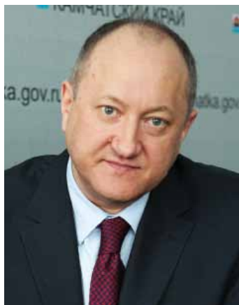
Владимир Илюхин Губернатор Камчатского края

Сегодня нам есть, чем гордиться: АПК края на пороге нового расцвета. На Камчатке открываются крупные сельскохозяйственные предприятия, возобновляют работу старые комплексы. К примеру, в начале 2012 года в Ели-